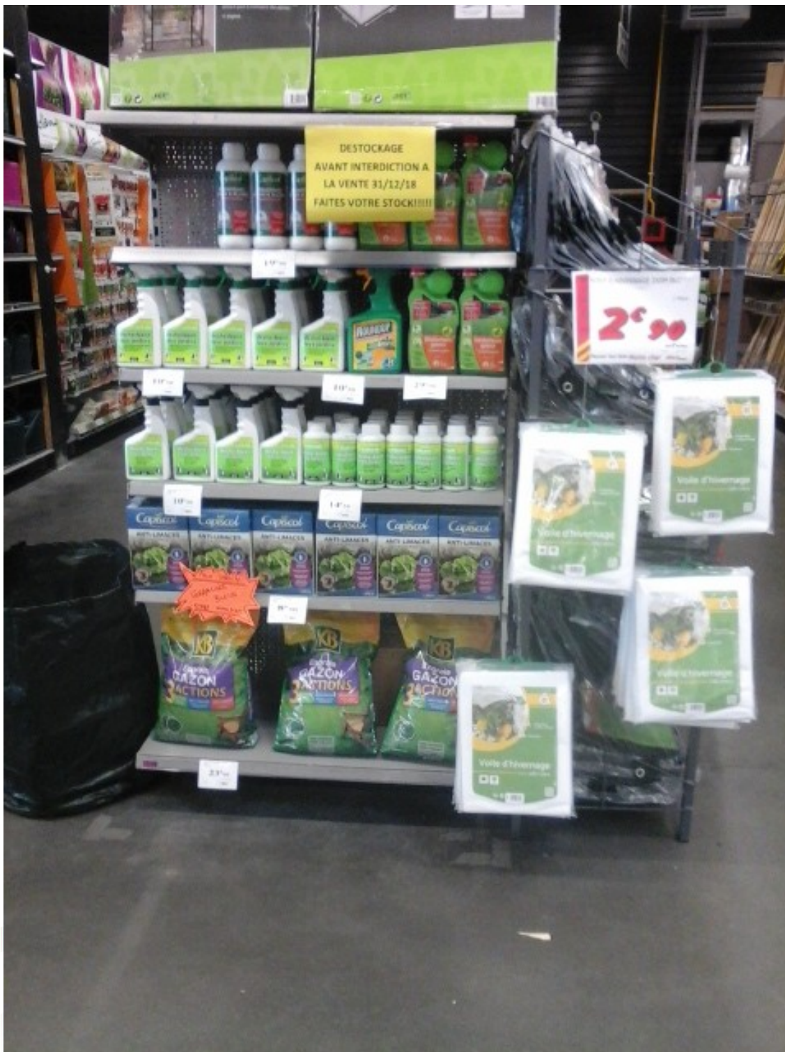
Photo prise au magasin Bricomarché de Carhaix(29), le 12 octobre 2018 :

Tél. : 02.96.21.14.70 - Courriel : pesticides@eau-et-rivieres.asso.fr