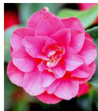
Chargé de mission collecte de fonds privés Brest - Rennes (recrutement en cours)